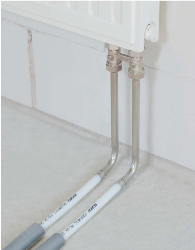
Fig. 5-4 Calorifer cu ventil cu țijă de racordare în L RAUBASIC la calorifer din pardoseală