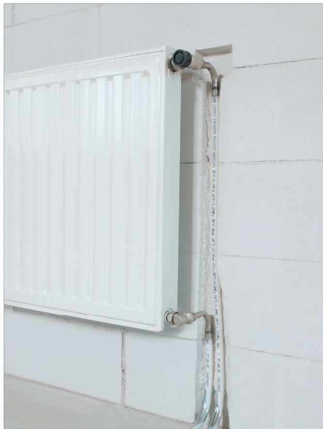
Fig. 5-1 Calorifer compact cu tijă de racordare în L RAUBASIC la calorifer

Îmbinările cu piuliță și inel de strângere nu sunt standardizate. REHAU recomandă utilizarea unor piulițe de presare și ventile potrivite de la un singur producător și respectarea indicațiilor acestui producător.